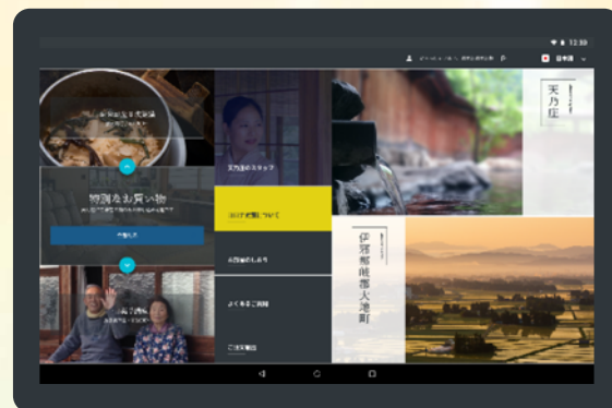
cocodakeのホーム画面イメージ

cocodakeは、旅館・ホテルの客室を物販の「ショールーム」として活用し、お客様に「ココだけ」でしか手に入らないモノ（伝統工芸や家具、調度品など）を実際に触ったり、使ったり、食したりして頂き、気に入ればすぐにタブレット端末を使って客室で購入が行える“体験「Eコマースツール」”です。